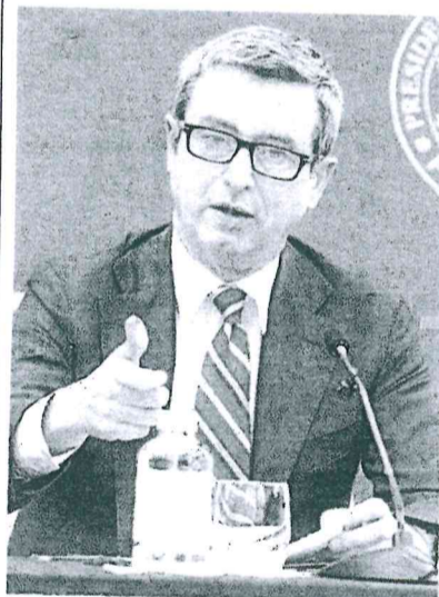
▲ Andrea Orlando

E il lavoro part-time riguarda ormai un terzo dei dipendenti, specie le donne